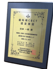
認定医プレート (縦24cm×横18cm)

お申し込み：QRコードまたは下のURLの Googleフォームからお申し込みください。